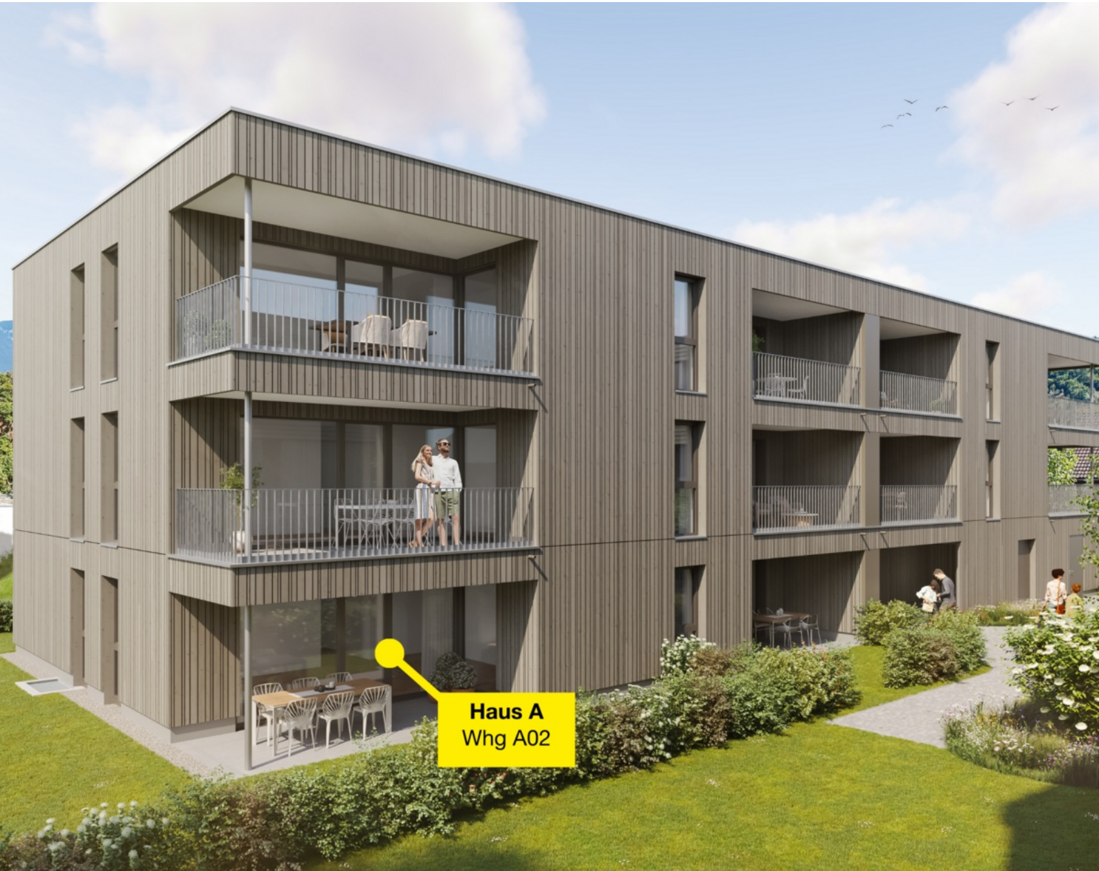
Haus A Whg A02