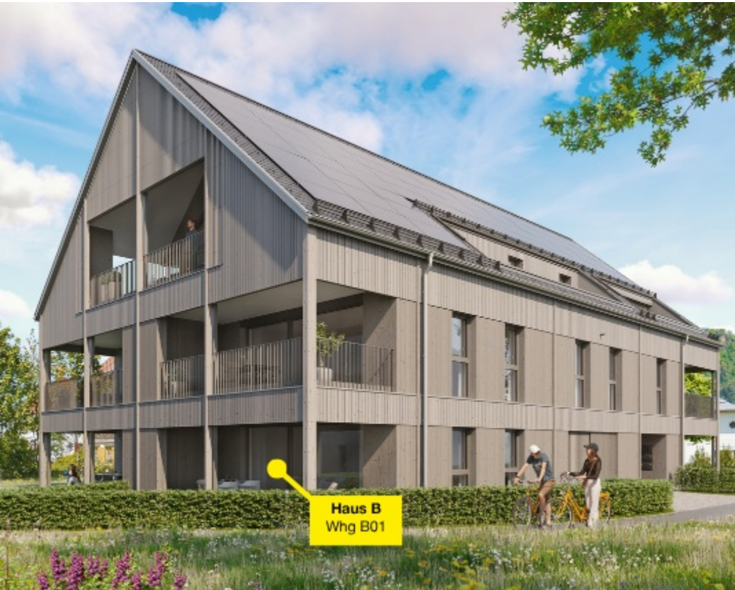
Haus B Whg B01